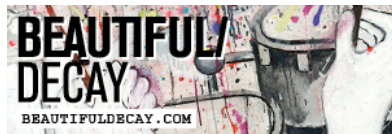
Advertise on Frizzifrizzi